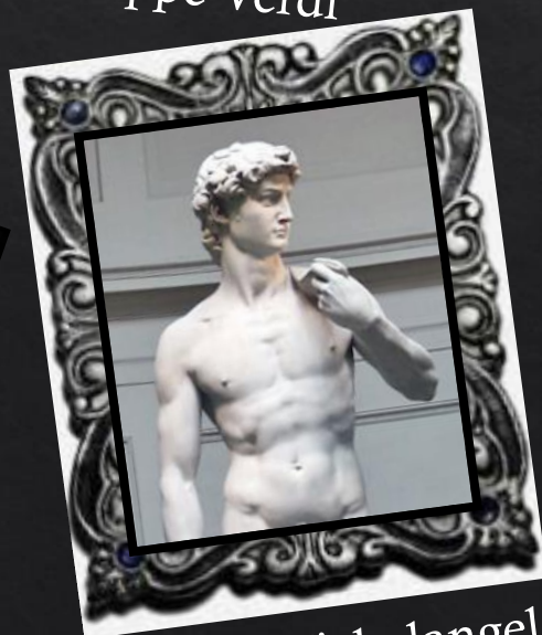
Il David (Michelangelo)