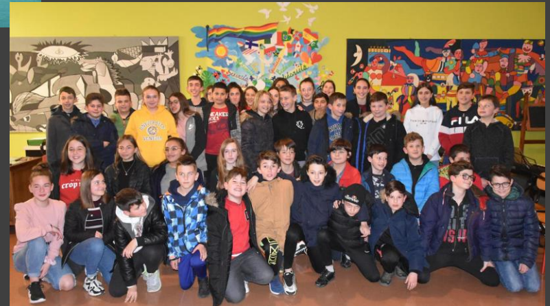
Avec nos correspondants, soirée d'au revoir

Chaque élève de LV2 italien aura dès la 5 ème un correspondant italien (de Breganze , près de Venise ) et un échange sera organisé lors de l'année de 4 ème pour le rencontrer, découvrir sa région et l'accueillir en France à son tour !