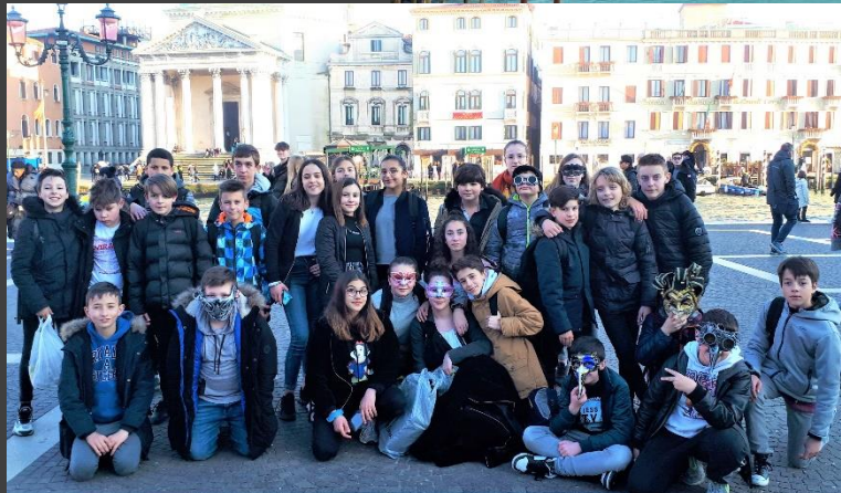
Lors de notre visite de Venise en février 2020

Chaque élève de LV2 italien aura dès la 5 ème un correspondant italien (de Breganze , près de Venise ) et un échange sera organisé lors de l'année de 4 ème pour le rencontrer, découvrir sa région et l'accueillir en France à son tour !